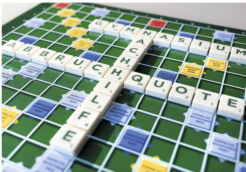
Ob Gymnasiastinnen und -schüler Nachhilfeunterricht nehmen oder nicht, ist nicht relevant für die Abbruchquote.

Rund ein Fünftel der Gymnasiastinnen und Gymnasiasten in der Schweiz absolvieren das Gymnasium nicht in der Regelzeit, sondern repetieren mindestens einmal. Diese Repetitionen können volkswirtschaftlich von Bedeutung sein. In jedem Fall verursachen sie persönliche Kosten, sei es durch eine verringerte Bildungsrendite, durch die verlängerte Bildungsdauer oder durch psychologische Kosten aufgrund des «Scheiterns». Über 34 Prozent der Schülerinnen und Schüler besuchen am Ende der obligatorischen Schule bezahlte Nachhilfe. Zwei Drittel dieser Schülerinnen und Schüler gehen regelmässig in den Nachhilfeunterricht.