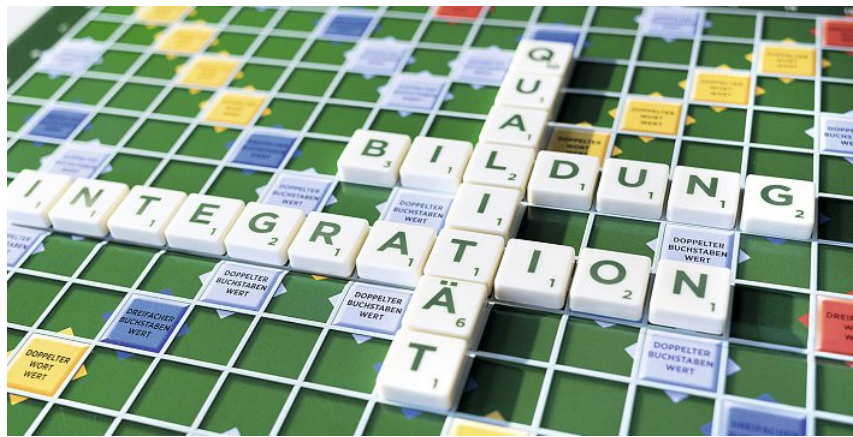
Der Bildungsbericht Schweiz liefert mit seinen aufbereiteten Informationen zum Bildungssystem eine Basis, um langfristig die Qualität zu steigern.